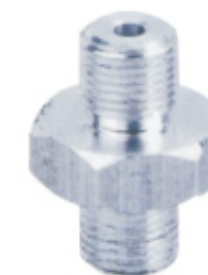
YVT 60 - G1M